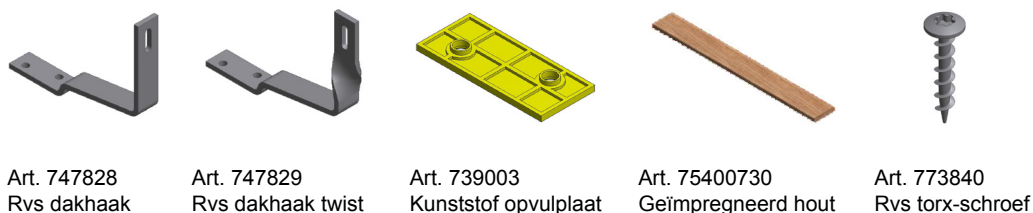
Art. 747828 Rvs dakhaak