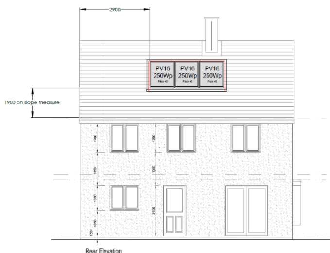
Plots 227 & 228